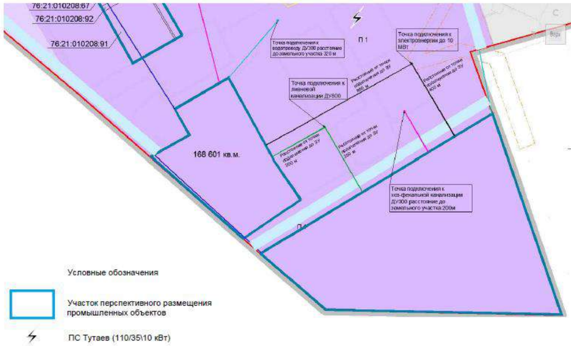
Схема участка №3 (76:21:010208:103)