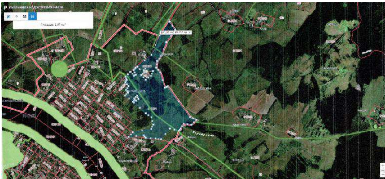
Схема расположения земельного участка:

(участок находится в кадастровом квартале 76:21:020201)